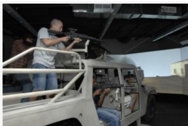
Jongeren leven zich uit in het Army Experience Center in een groot winkelcentrum in Philadelphia. Het Amerikaanse leger probeert zo nieuwe militairen te werven.

Er is ook kritiek. Oorlog zou te zeer als een spelletje worden voorgesteld. "Een cliché", vindt sergeant Cianchetti. "Dat zeggen mensen die niets weten van dit centrum. Een spel als American Army is echt een leerinstrument, iedereen begrijpt dat het een videogame is."